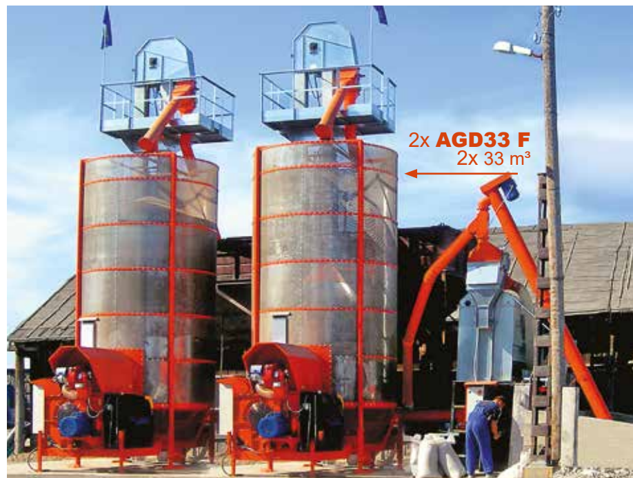
Flexible in line installations up to 15 t/h Flexible Anlagen bis 15 t/h