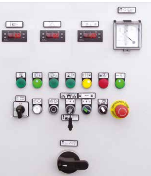
Stationary electrical panel with working devices Stationäre Schalttafel mit Arbeitsgeräten